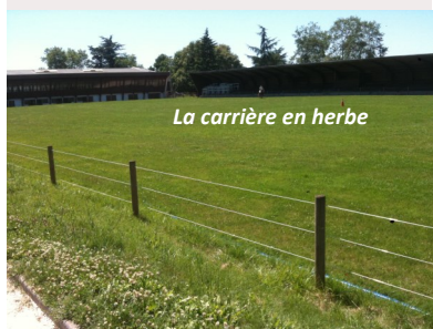
La carrière en herbe

Nous comptons sur vous à Poitiers ! Venez nombreux.