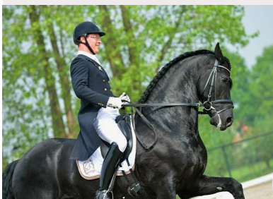
Yk Sybren 63,5% en Prix Saint George